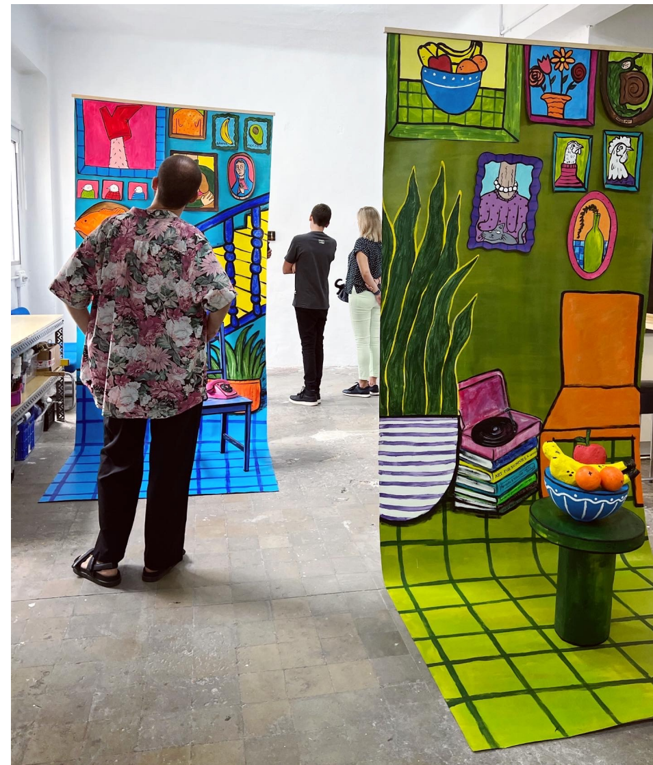
Salon vert et escalier jaune 2023 Installations : toile et sculpture respectivement 350 x 120 cm