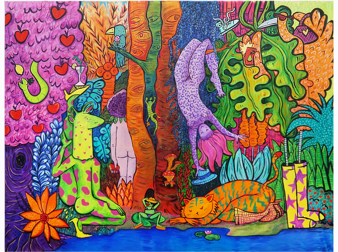
La jungle des délices, huile sur toile 200 x 270 cm