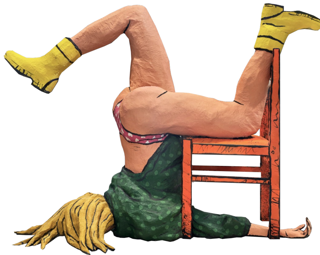
Je ne sais pas comment m'asseoir sur la chaise adulte 2023 Sculpture en papier mâché, plastique et bois finition acrylique 110 x 145 x 80 cm 15 Kg